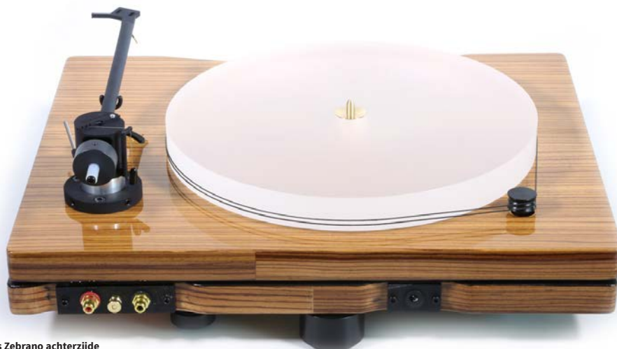
New Horizon GDS II in hoogglans Zebrano achterzijde