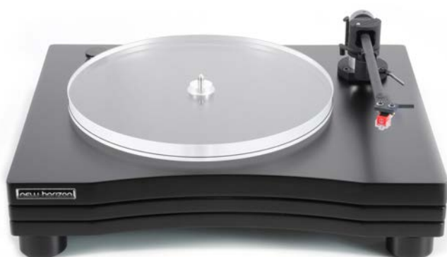
New Horizon GD203 in zwart

Alle modellen in de 200 Series worden zoals gezegd geleverd met de uitgebreid instelbare 9 inch NH95 toonarm, gemaakt van Alumide®. Een extra contragewicht maakt toepassing van nagenoeg alle gangbare elementen mogelijk en wordt als standaard bijgeleverd. In de basisversie is een Audio Technica AT91R MM element voorgemonteerd en afgeregeld. Optioneel en met groot voordeel zijn alle modellen in de Series 200 verkrijgbaar met een Ortofon 2M Red of 2M Blue element, hetgeen al deze modellen het predicaat Plug & Play geeft. Deze draaitafels worden in ovengeharde mat witte en mat zwarte lakuitvoering geleverd.