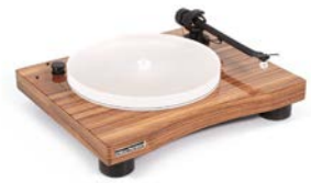
New Horizon GD301 in Zebrano