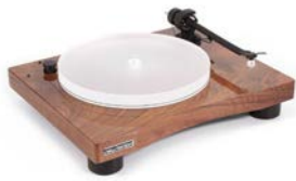
New Horizon GD301 in Redwood