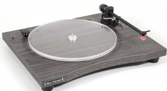
New Horizon GD129 in donker hout

Nieuw aan het New Horizon firmament is een doorontwikkeling van de GD121 die GD129 is gedoopt. Wat het meest in het oog springt, zijn de verschillende afwerkingen in licht en donker hout, naast de bestaande zwarte uitvoering. Het zal misschien alleen de opletende vinylleefhebber opvallen, maar de toonarm is volledig vernieuwd en door New Horizon zelf gefabriceerd. Deze NH91 toonarm is nog steeds recht, maar nu 9 inch in lengte en gemaakt van Alumide®, een aluminium versterkt polymeer met een enorme stijfheid, hetgeen de klank en werking van de toonarm ten goede komt. Zelfs azimuth en antiskating kunnen worden ingesteld, hetgeen uniek is voor draaitafels in deze prijsklasse. De stijlvol vormgegeven behuizing is een enkele 25 mm hoge gelamineerde sokkel van resonantie-arm hout. Deze sokkel is uitgevoerd met drie brede, massieve stelvoeten van natuurrubber wat stabiele en loodrechte opstelling op elk oppervlak mogelijk maakt. De 12 mm hoge transparante (acryl) draaischijf weegt een respectabele 1050 gram en is voorzien van een groef die aflopen van de snaar onmogelijk maakt. De aandrijving geschiedt middels een AC synchroommotor die de noodzakelijke energie via een ronde siliconen snaar naar de draaischijf overbrengt. Om te wisselen van 33 naar 45 tpm volstaat het simpelweg omleggen van de snaar. De ont koppeling van de motor wordt met vier afgestemde veren bereikt. De GD129 meet 450 x 365 mm (bxd) en wordt geleverd inclusief stofkap.