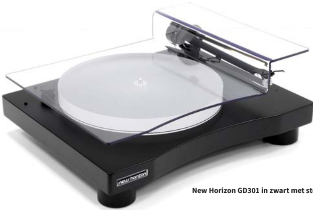
New Horizon GD301 in zwart met stofkap