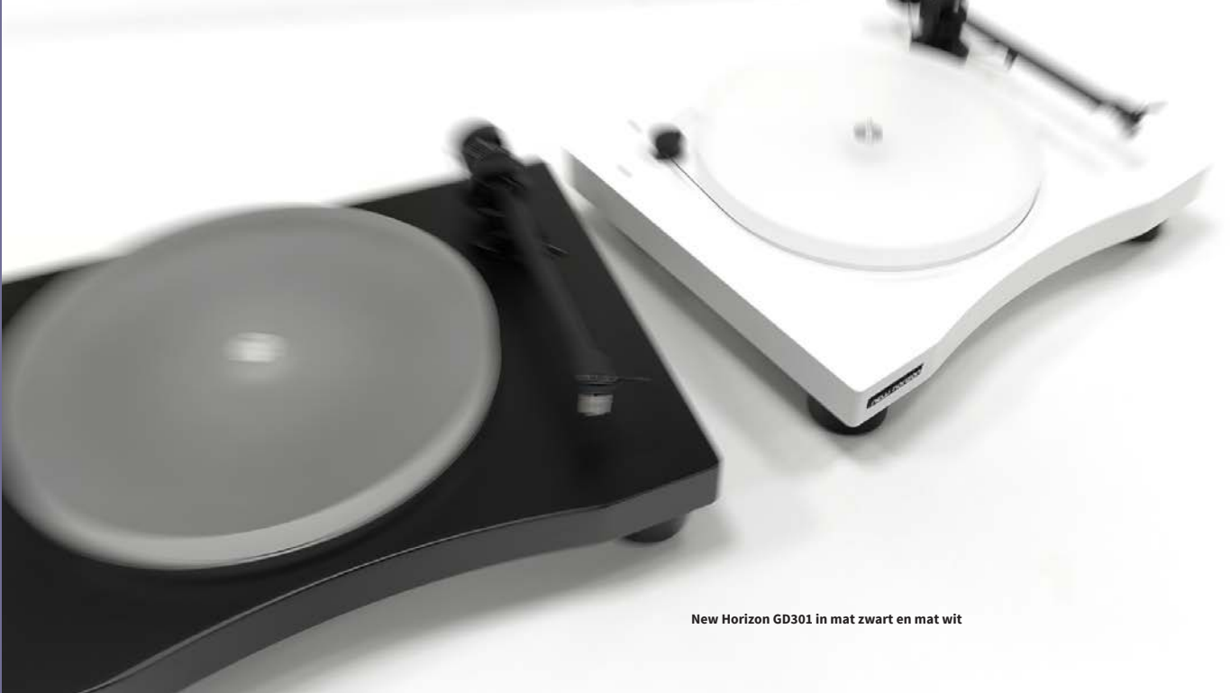
New Horizon GD301 in mat zwart en mat wit