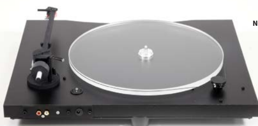
New Horizon GD129 in zwart