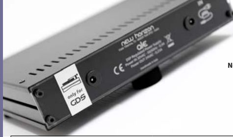
New Horizon ALE DSP geregelde voeding