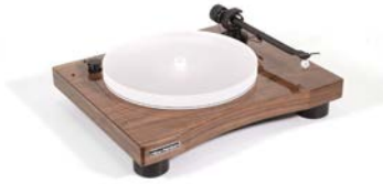
New Horizon GD301 in Walnoot