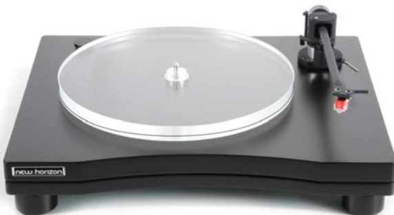
New Horizon GD202 in zwart