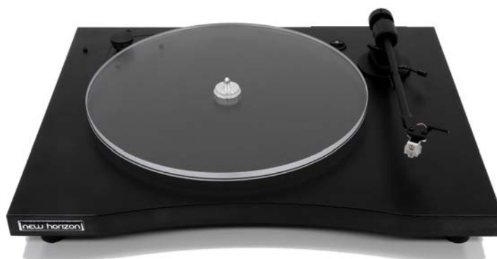
New Horizon GD101 in zwart

Dit Italiaanse merk verstaat als geen ander de kunst om een bijna ongeloofwaardige hoeveelheid kwaliteit voor het geld te bieden. Wat dacht je bijvoorbeeld van een omgekeerd precisielager in alle modellen. Het instapmodel, de GD101 is helemaal Plug & Play. Zo, hup uit de doos, een plaat erop en draaien maar. Uiterlijk verschilt dit model maar weinig van de modellen die erboven gepositioneerd zijn. Voor slechts € 399,00 krijg je een 8,6 inch aluminium toonarm, compleet geleverd met voorgemonteerd en afgeregeld Audio Technica AT-91R MM element. De stijlvol vormgegeven behuizing is een enkele 25 mm hoge zwart gelamineerde sokkel van resonantie-arm hout. De sokkel is uitgevoerd met drie brede, massieve, stelvoeten van natuurrubber wat stabiele en loodrechte opstelling op elk oppervlak mogelijk maakt. De 10 mm hoge transparante (acryl) draaischijf weegt een respectabele 850 gram en is voorzien van een groef die aflopen van de snaar onmogelijk maakt. De aandrijving geschiedt middels een AC synchroonmotor die de noodzakelijke energie via een ronde siliconen snaar naar de draaischijf overbrengt. Om te wisselen van 33 naar 45 tpm volstaat het simpelweg omleggen van de snaar. De ont koppeling van de motor wordt met vier afgestemde veren bereikt. De GD101 meet 450 x 365 mm (bxd) en wordt geleverd inclusief stofkap. De GD101 is tegen een geringe meerprijs verkrijgbaar met een 12 mm hoge en 1050 gram zware draaischijf en heet dan GD121.