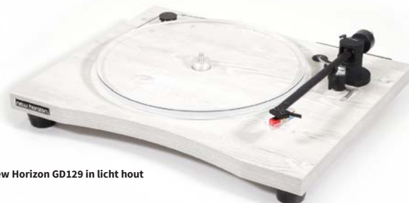
New Horizon GD129 in licht hout