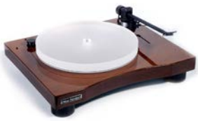
New Horizon GD301 in Wengé