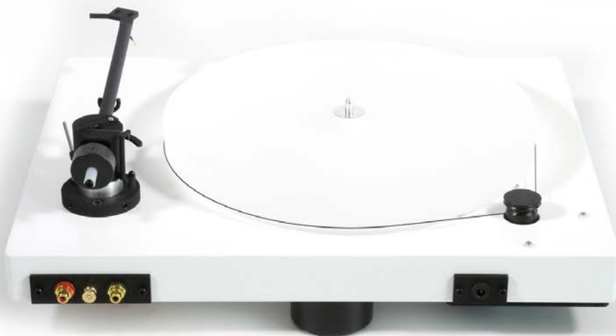
New Horizon GD301 in wit achterzijde