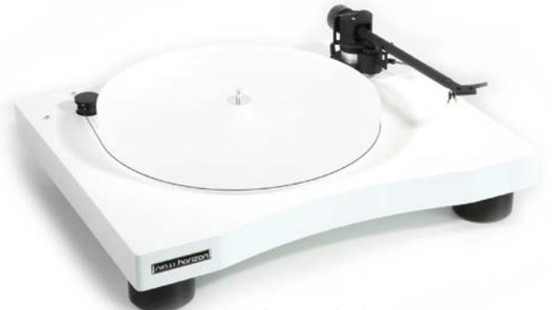
New Horizon GD301 in wit