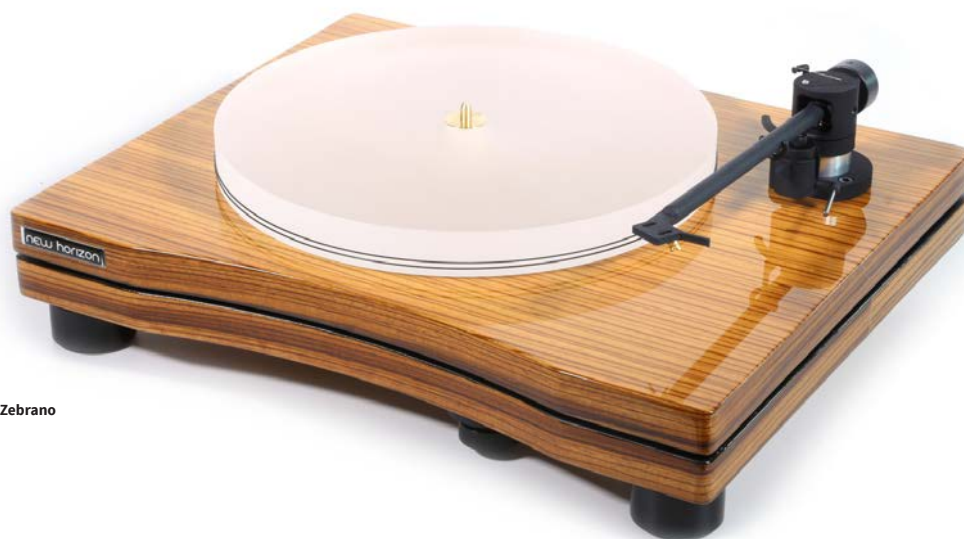
New Horizon GDS II in hoogglans Zebrano