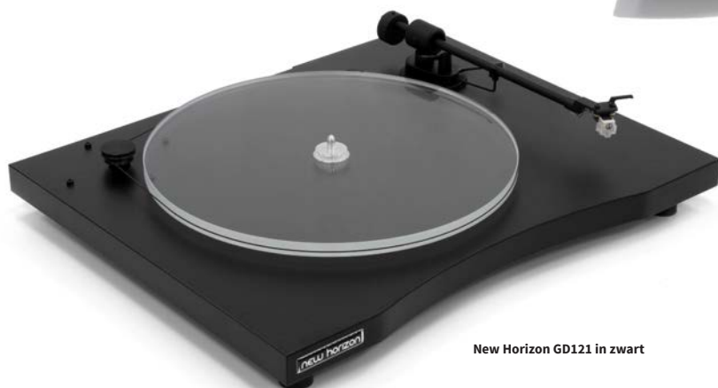
New Horizon GD121 in zwart