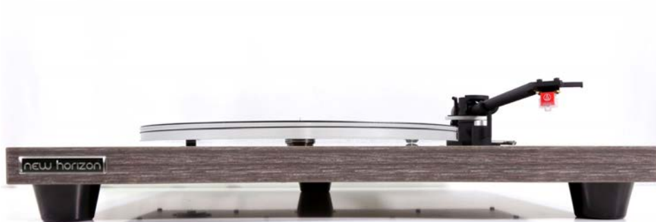
New Horizon GD129 in donker hout