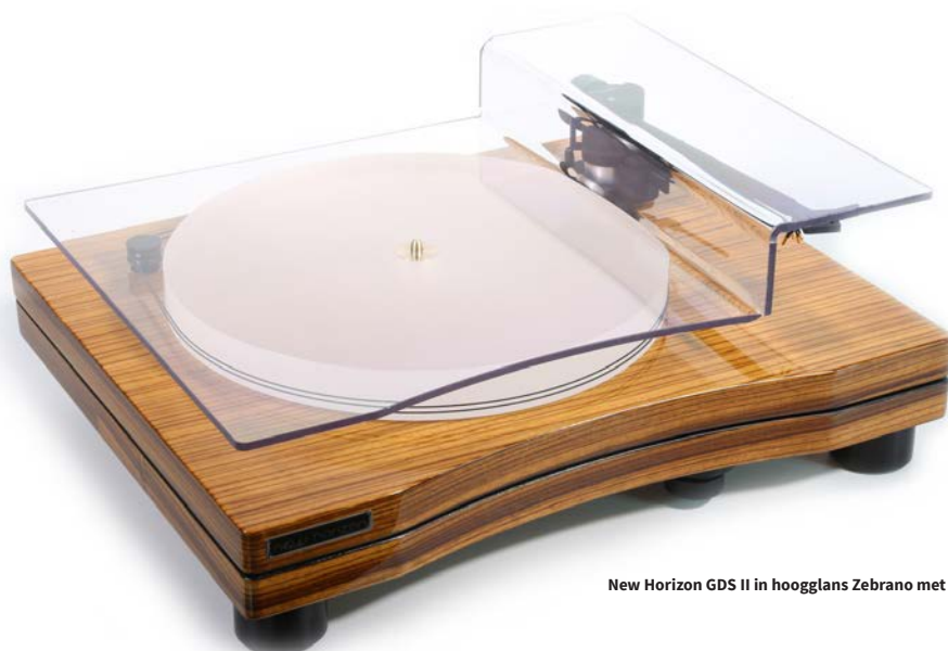
New Horizon GDS II in hoogglans Zebrano met stofkap