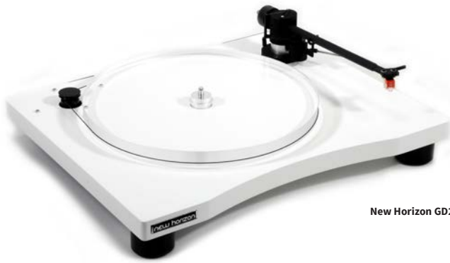
New Horizon GD201 in wit